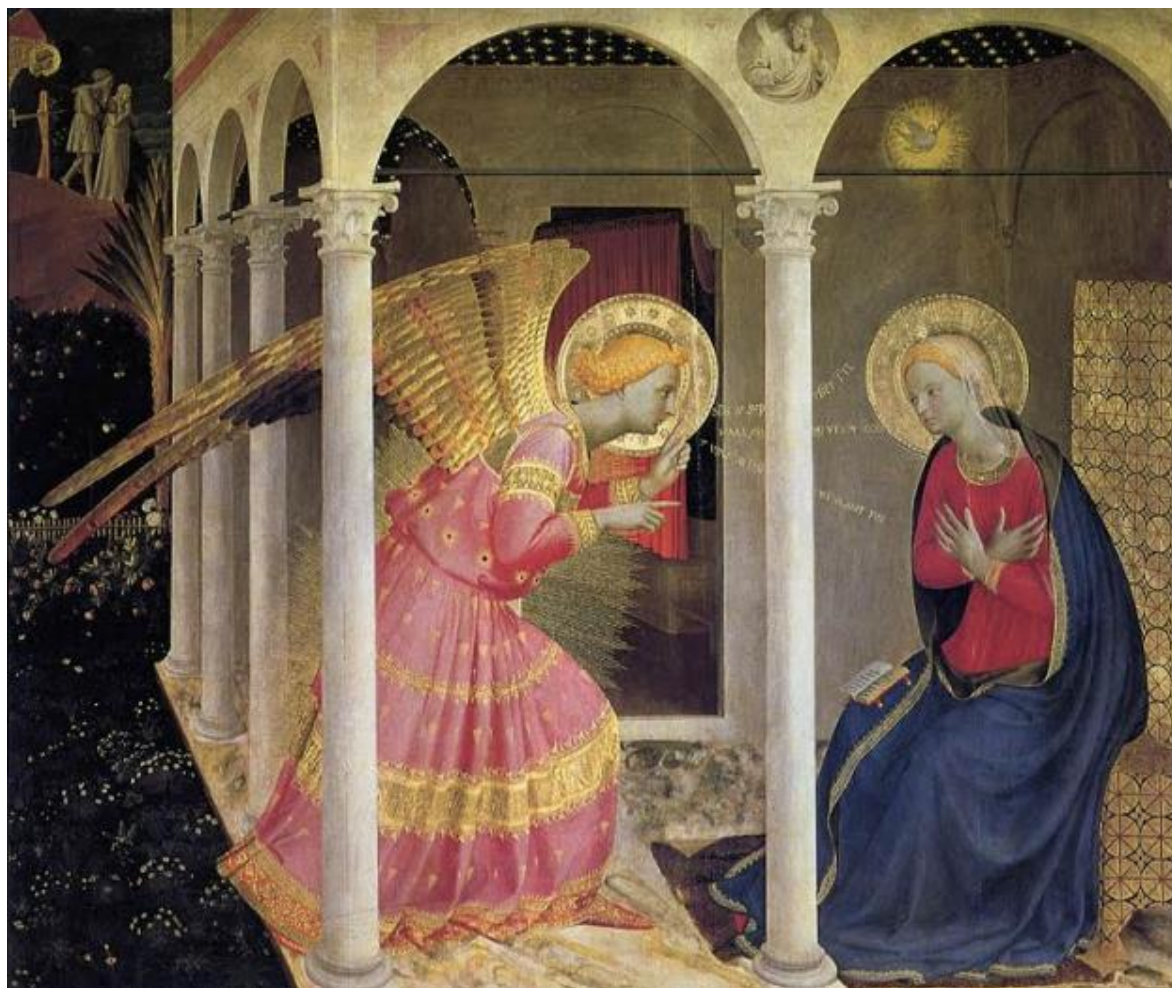
Anunciação de Fra Angelico

A partir do primeiro domingo de Advento (27 de novembro), temos quatro semanas de espera por aquele que há de vir no Natal. Não se trata de lembrar um acontecimento histórico de dois mil anos atrás, mas de viver um acontecimento novo, que é recorrente a cada ano. Na palavra "espera" há algo de passivo, mas não precisa ser assim necessariamente. Há um lado ativo na espera, se enfatizamos a preparação para a chegada do Cristo. À semelhança da Maria, grávida do menino Jesus, podemos vivenciar essa espera como se